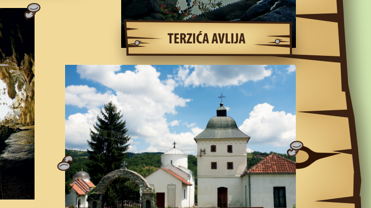
BELA CRKVA - KARAN